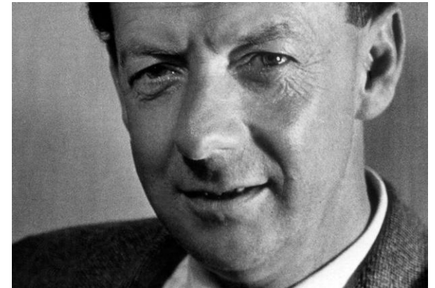
Benjamin Britten 1913 - 1976